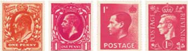
I quattro re nel valore da 1 penny, rimasto di colore rosso per oltre un secolo, dal 1841 al 1950

La busta e il foglio-lettera Mulready da 1 penny in color nero, e qui a fianco una delle numerose caricature apparse anche dopo la loro sostituzione: la n° 1 edita da R. W. Hume di Leith che presenta anche i quattro triangoli al retro illustrati